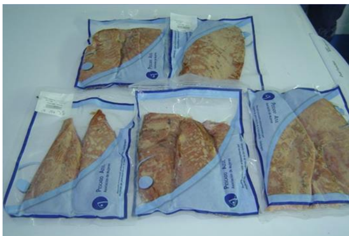
Figura 8.- Presentación de empackado al vacío de pescado ahumado de la Asociación Pescado Azul.

“El producto era de alta calidad, se vendía muy bien acá en Santa Cruz, la verdad que era muy rico. Empezaron a diversificar el tipo de productos que tenían, hacían una especie de paté, unas como rodajas” (Actor institucional, 22/03/2021).