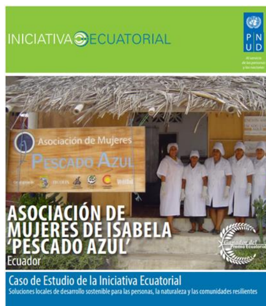
Figura 10.- Portada de Iniciativa Ecuatorial. Se muestra a Pescado Azul como uno de los ganadores del Premio Ecuatorial.

“También nos dieron cursos y charlas que nos pagaban, ¡nos íbamos a Santa Cruz, a San Cristóbal!” (Socia, Pescado Azul, 03/02/21).