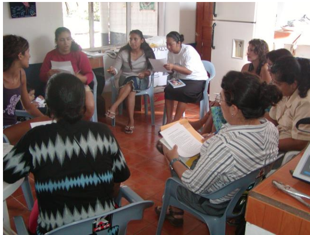
Figura 5.- Reunión de socias de “Pescado Azul”.

Pescado Azul tuvo una presidenta, la principal líder de la Asociación, durante la mayoría de los años, dejando su cargo en la fase final a otra de las socias entre el año 2008 y 2010. La mayoría de las socias entrevistadas comentaron que las decisiones se tomaban de manera conjunta. Para esto, de acuerdo al acta constitutiva de la Asociación, se hacían reuniones mensuales en donde decidían los turnos y actividades por ejecutar. En las reuniones, era la presidenta la que indicaba los puntos a discutir y luego se procedía a conversar y decidir de manera conjunta. Esto, según ellas, fue más fácil al final cuando eran seis socias. Sin embargo, algunas de las socias entrevistadas también mencionaron que no todas las decisiones tomadas por la presidenta eran consultadas y/o informadas con todo el grupo.