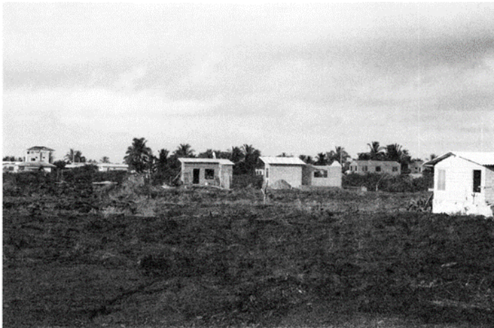
Figura 2.- Isabela en la década de los años 2000, vista del área urbana de Puerto Villamil.

“En ese momento se dio un crecimiento muy grande del comercio de la aleta de tiburón; lo que se procuraba de alguna manera era ver cómo se podía ayudar a estas familias dando alternativas, que no era muy fácil” (Actor institucional, 24/02/2021).