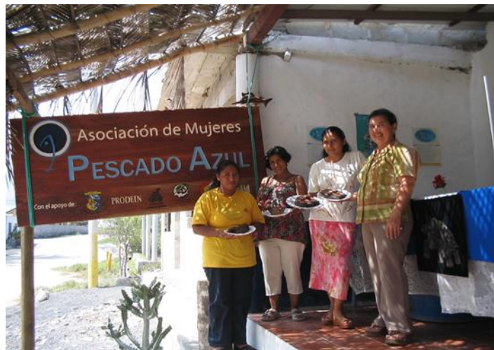
Figura 3.- Socias mostrando platos elaborados con productos de la Asociación.

La Asociación de Mujeres Pescado Azul estuvo constituida por un grupo de mujeres, en su mayoría esposas de pescadores, que se dedicaban a la producción y venta de pescado ahumado, croquetas y paté. De acuerdo con Bigue, Bravo & Cruz (2006) la Asociación inició sus labores de organización en septiembre del 2001 y se estableció formalmente entre enero y febrero del 2002.