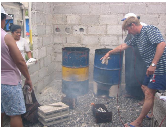
Figura 4.- Capacitación inicial de ahumado de pescado con tanques de aceite.

En el Acta Constitutiva de la Asociación (Anexo 8) se reconocen a 16 mujeres de isla Isabela como fundadoras. El nombre “Pescado Azul” fue seleccionado por votación entre las participantes iniciales. Este nombre fue sugerido por la lideresa de la iniciativa, quien aprendió en una capacitación que realizó en España que “era el pescado azul el que tenía la mejor ‘calidad de carne, en términos de textura y valor nutricional’ . Los/as entrevistados/as contaron que en el inicio de la producción se horneaba el pescado de manera artesanal utilizando tanques de aceite de 200 litros.