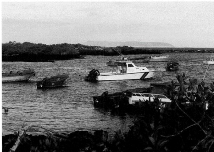
Figura 1.- Isabela en década de los años 2000, vista al “Embarcadero”.

“Es súper conocido todo lo que se hizo con la reserva marina con apoyo de la FCD y USAID: el plan de manejo de la reserva marina, el calendario quinquenal, la zonificación de la reserva marina, la junta de manejo participativo, eran todos casos súper exitosos de sostenibilidad que lograron superar una situación muy conflictiva que había justo cuando llegue yo, era la época de huelgas terribles de pescadores, de toma de oficinas.... Esa época tan conflictiva creo que se solucionó bastante bien, eso fue una iniciativa muy importante. Hubo muchas iniciativas para ayudar a la comercialización de productos pesqueros, mucha investigación para gestionar las pesquerías de pepino y langosta, hubo muchas iniciativas en pesquerías. Luego trabajamos bien con la cooperativa de pesca en Isabela, el presidente era Lenin en esa época y después de una desconfianza inicial creo hicimos bastantes cosas, sobre todo en la zona de los humedales y de apoyo con los pescadores” (Actor institucional, 05/02/2021).