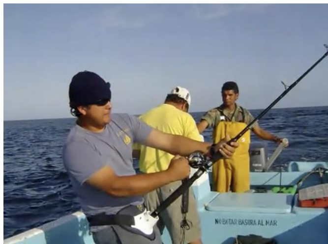
Figura 7.- Pescadores de Isabela durante la captura de recursos marinos.

Sin embargo, cuando no había pescado fresco, adquirían la materia prima congelada directamente de la cooperativa COPAHISA.