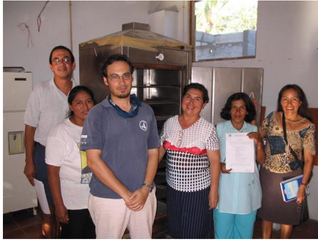
Figura 9.- Taller de empacado al vacío de pescado ahumado de la Asociación Pescado Azul.

“En ese tiempo había personas mayores que nunca habían tenido la oportunidad de salir o escuchar una reunión” (Socia, Pescado Azul, 25/01/2021).