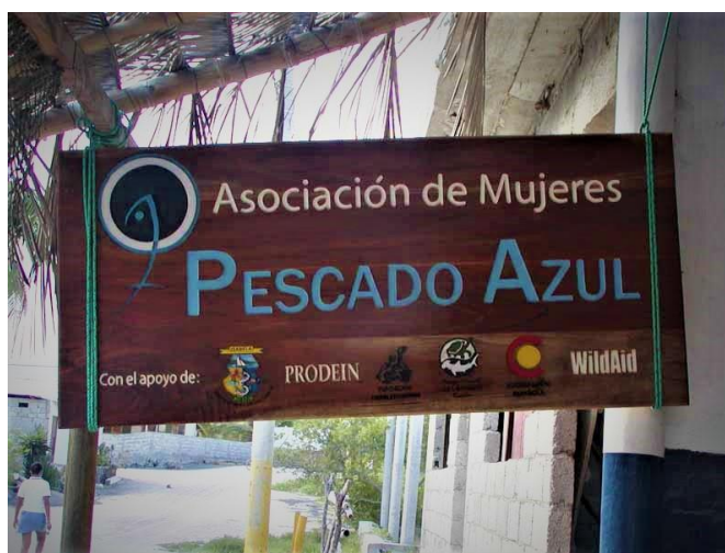
Figura 6.- Letrero del local de la Asociación de Mujeres Pescado Azul con logos de cooperantes.

De acuerdo con los resultados de las entrevistas, las Organizaciones No Gubernamentales (ONGs) estuvieron bastante activas en Galápagos en la época de Pescado Azul. En este contexto Pescado Azul tuvo mucho apoyo de organizaciones como la Agencia Española de Cooperación Internacional para el Desarrollo (AECID), Agencia de los Estados Unidos para el Desarrollo Internacional (USAID), World Wildlife Found (WWF), Wild Aid y la Fundación Charles Darwin (FCD). Los apoyos estuvieron centrados en brindar talleres de capacitación relacionados con la producción de los productos (manipulación e higiene, fileteado y selección del pescado) y en la organización del grupo (liderazgo, fortalecimiento organizacional, contabilidad), compra de materiales y equipos (hornos ahumadores profesionales, máquina de envasado al vacío y frigoríficos) y comercialización de los productos (obtención del registro sanitario, elaboración de logotipo y apoyo en la apertura de mercado en las demás islas y en el continente).