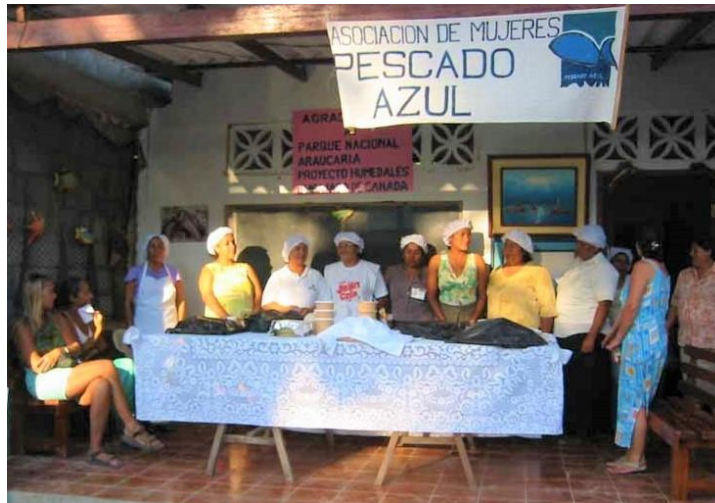
Figura 11.- Socias en degustación de productos de la Asociación Pescado Azul.

El grupo de mujeres que formaron parte de la Asociación Pescado Azul atravesaron por un proceso muy importante de empoderamiento. Es importante mencionar que para el contexto de este estudio, empoderamiento se define como el “Proceso por el que las personas, las organizaciones o los grupos carentes de poder (a) toman conciencia de las dinámicas del poder que operan en su contexto vital, (b) desarrollan las habilidades y la capacidad necesaria para lograr un control razonable sobre sus vidas, (c) ejercitan ese control sin infringir los derechos de otros y (d) apoyan el empoderamiento de otros en la comunidad” (Rowlands, 1995).