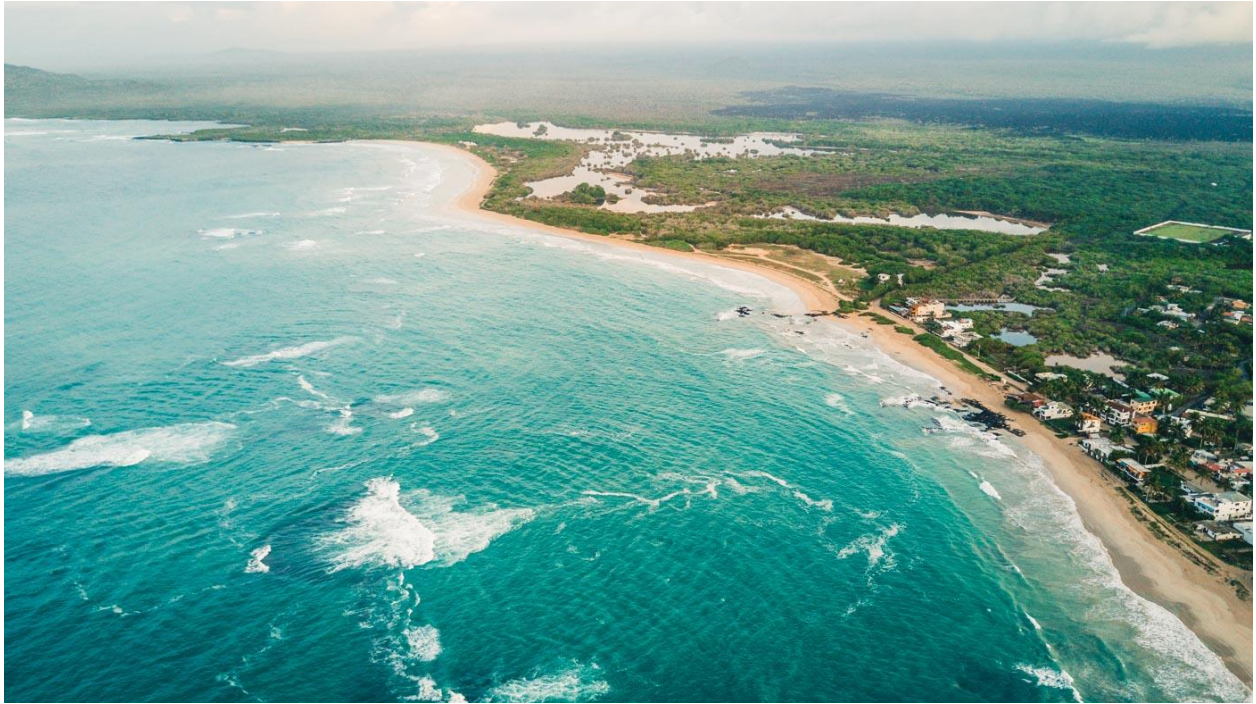
Foto: Vista panorámica de playas de Puerto Villamil, Isabela. Fuente: FCD (Archivo Digital), 2020